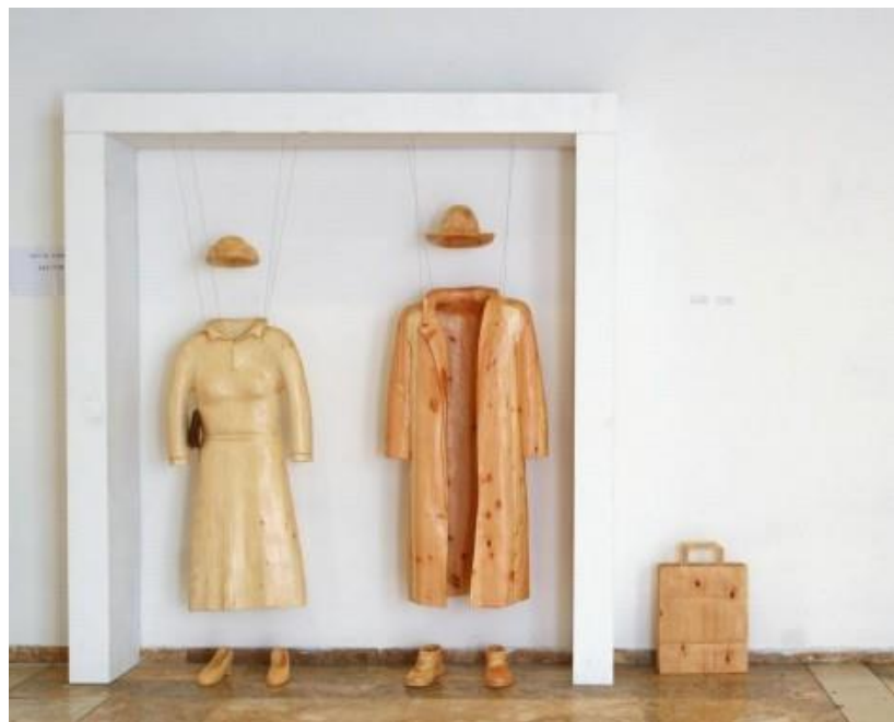
צולם בתערוכה בבנייני האומה

אבל כמו שטייאר מציין, ההתקרבות שלו לבורא לא הגיעה ברגע אחד. "כל התהליך הזה קרה לפני עשרים שנה, אט-אט, עם עבודה עצמית בלתי פוסקת, עד שלבסוף השתתפתי עם אשתי בסמינריון שחיזק אותנו מאוד. לאחר מכן זכינו לחזור בתשובה שלמה יחד עם שלושת ילדינו".