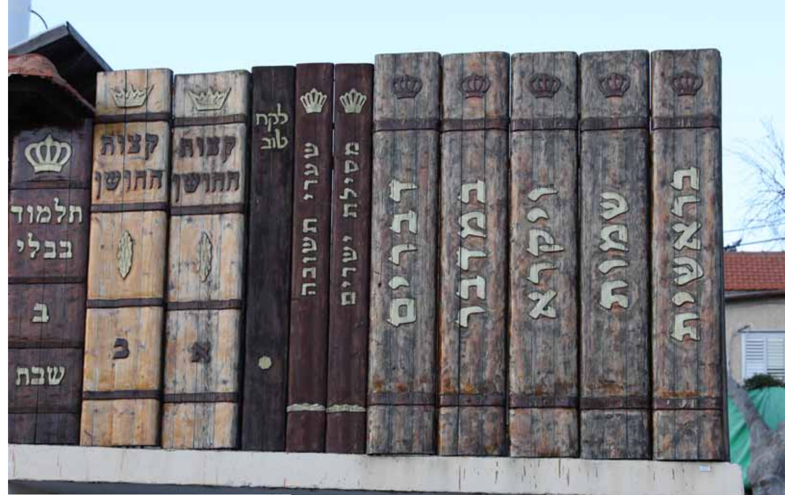
"ליצור כל דבר שבקדושה". גדד העץ בלב רכסים

להשלים אותו, ואני מקווה שהשאיפה הזו לא תיפסק לעולם".