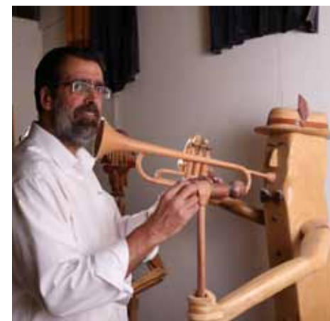
"מזונותי קצובים לי מלמעלה". טייאר עם חלק מיצירותיו